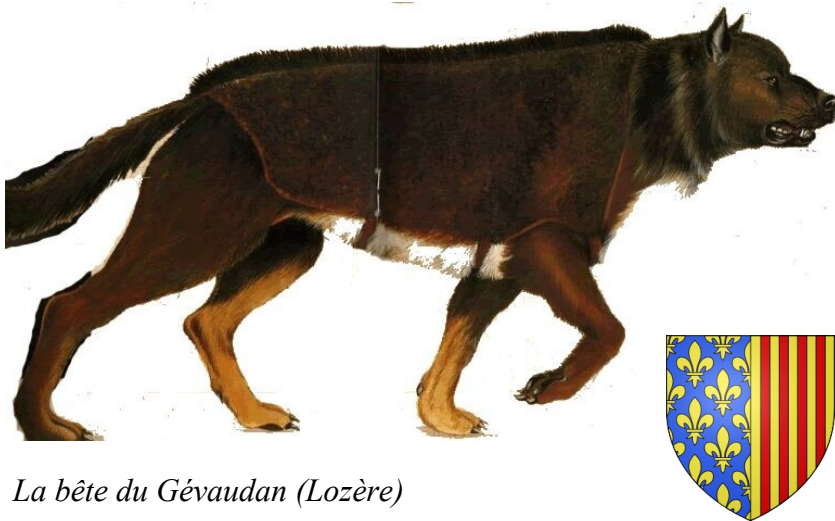
La bête du Gévaudan (Lozère)

Autrefois, les loups étaient très dangereux, ils attaquaient les hommes et leurs moutons car ils étaient poussés par la rage ou par « une faim de loup ». Maintenant, ils ont peur de l'homme et n'attaquent presque plus les moutons.