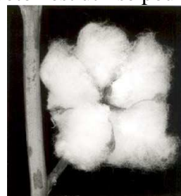
Graine de cotonnier

On peut le repasser à fer chaud. Le coton est hypoallergénique. Il est facile à laver. On peut faire bouillir le coton blanc. On peut facilement imprimer sa surface. Le coton est utilisé pour faire des fils mats ou brillants.