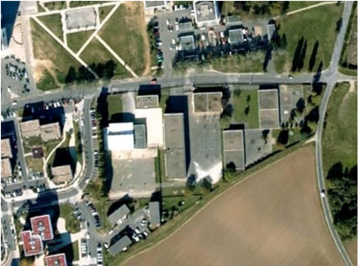
Notre école vue du ciel.