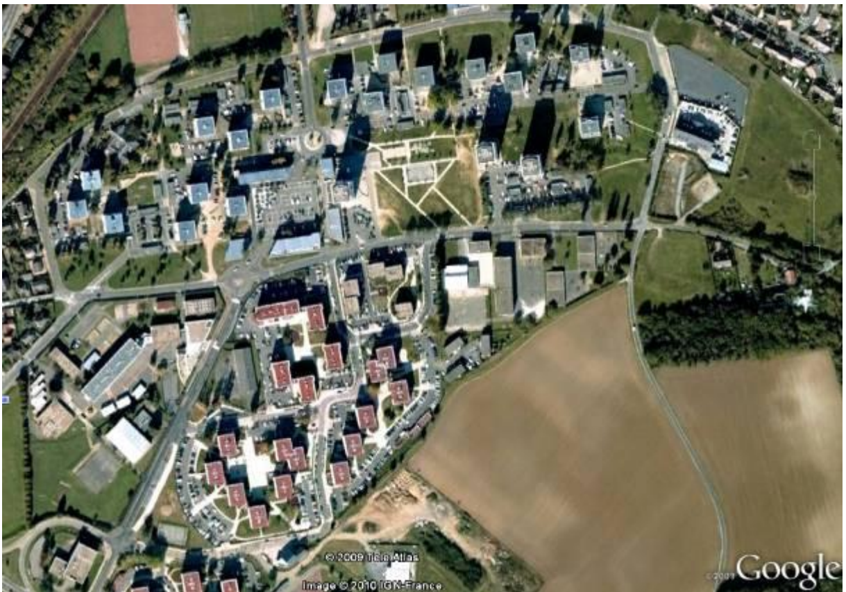
Notre école et les quartiers dans lesquels nous vivons.