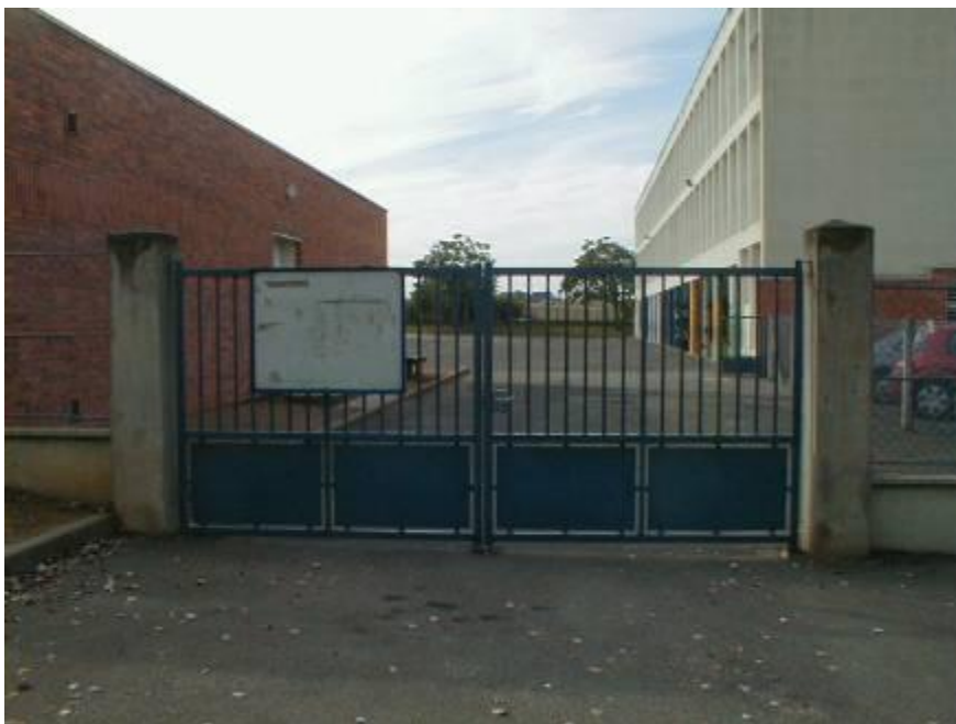
Notre école est située au 32 rue Henri Dunant. Le portail est ouvert à 8h35 le matin.