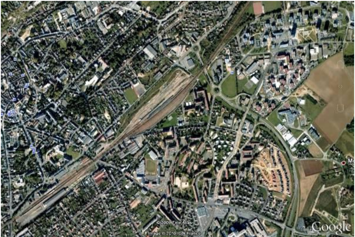
Un peu plus haut ! On voit la ligne de chemin de fer et la gare de Dreux.