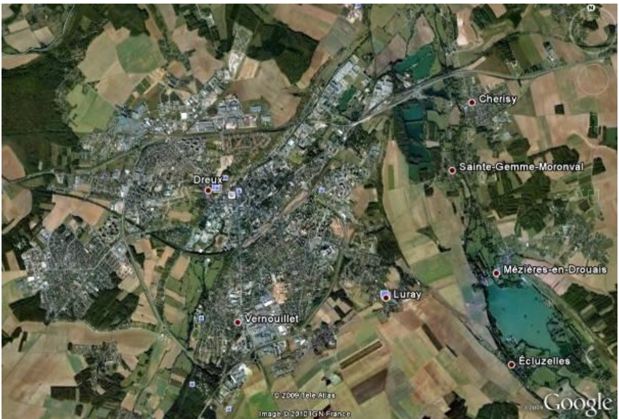
Encore plus haut ... On voit la ville de Dreux et tous les petits villages autour.